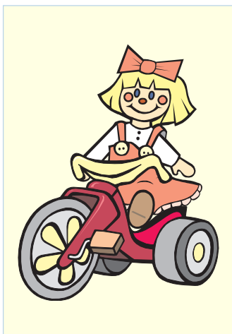
(кататься на велосипеде)