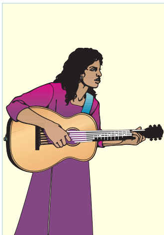
(играть на гитаре)